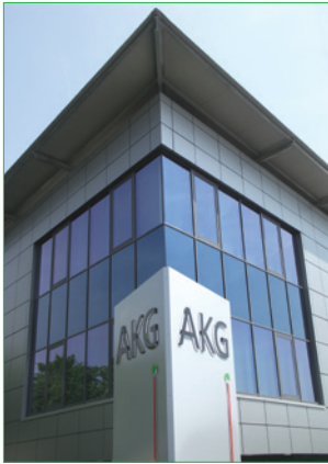
AKG Stammsitz Heitersheim