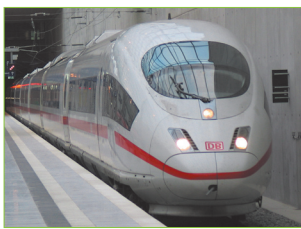
VESTRA Civil 3D Bahn