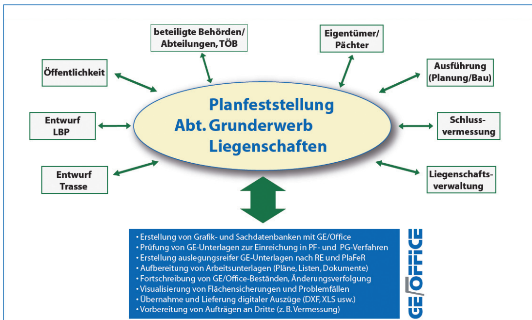
Abb. 3: Übersicht der Dienstleistungen „EDV-technische Unterstützung bei der Durchführung von GE-Maßnahmen“