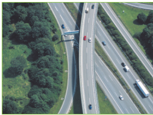
Civil 3D Straße