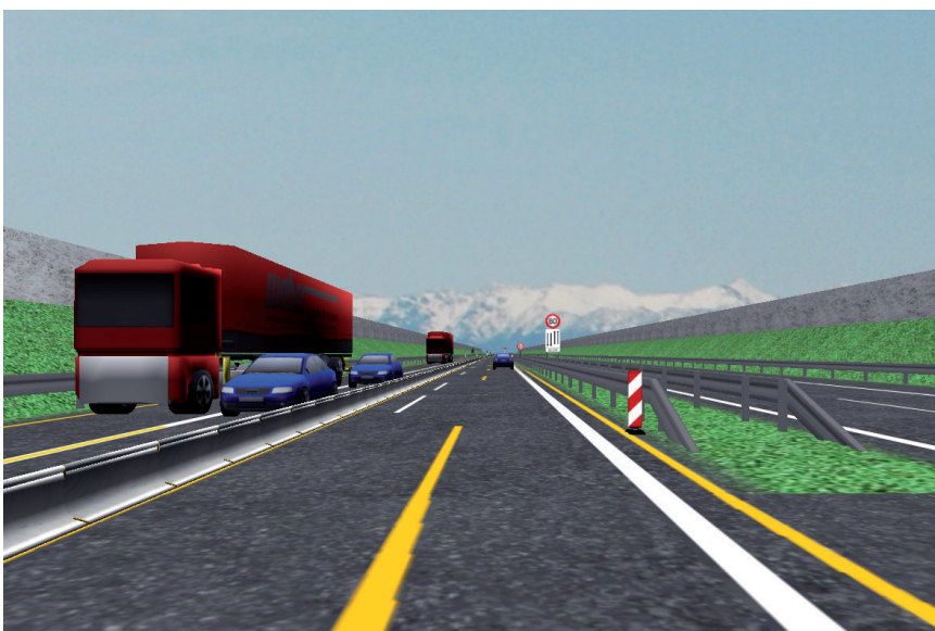
Beispiel Studienarbeit: Simulation einer 4+0-Baustellenverkehrsführung

Der Autor war am Lehrstuhl für Straßenwesen, Erd- und Tunnelbau der RWTH Aachen für die Entwicklung und den Betrieb des Fahrsimulators zuständig. Seit Juli 2010 ist er im Ulrich Lank Ingenieurbüro Köln tätig.