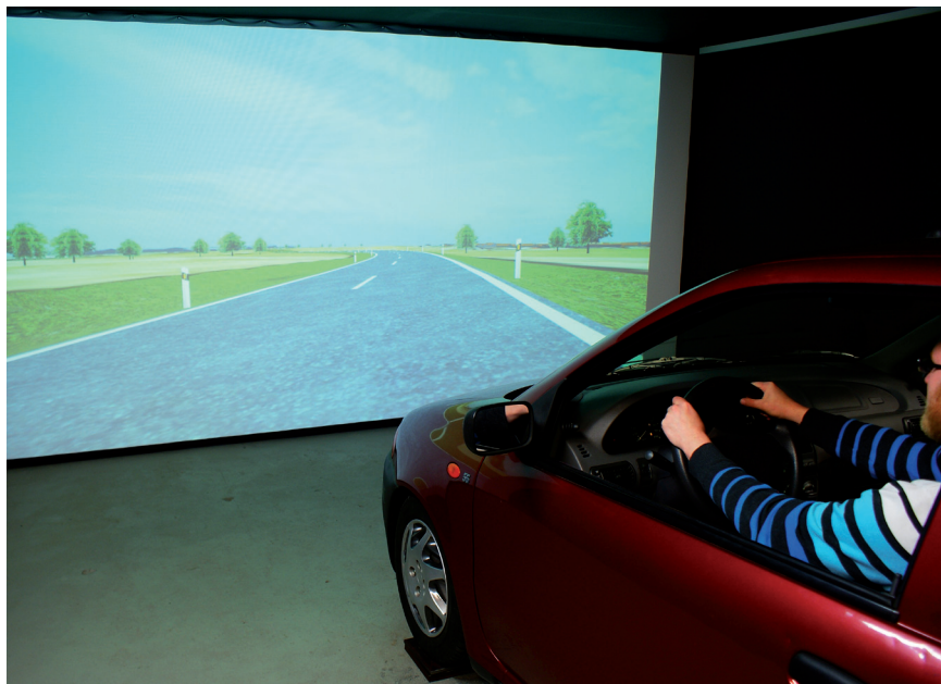
Ansicht Fahr Simulatorkabine

Im Wesentlichen besteht der isacFaSi in der aktuellen Ausbaustufe aus einer Fahrgastzelle, die mit Mess- und Steuertechnik ausgestattet ist. Über die entsprechende Sensorik können die Steuersignale des Fahrers (Lenkeinschlag, Pedalstellungen, Schalter) aufgenommen und verarbeitet werden. Über die Steuereinheit erfolgt die Rückkopplung mit dem Fahrzeug. Die virtuelle Welt wird dem Probanden durch eine echtzeitfähige 3D-Visualisierung und 3D-Sound dargeboten. Der Straßenraum wird hierbei über eine Frontalprojektion und die Rückspiegel dargestellt. Bei der Erzeugung der virtuellen Welt kommt eine Kombination aus Open Source -Software (Blender), eigenentwickelter und kommerzieller Software (unity 3 ) zum Einsatz, um ein Höchstmaß an Performance und Flexibilität zu erreichen.