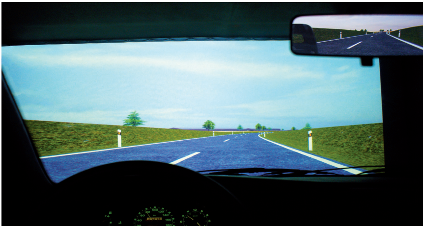
Beispiel Ortsumgebung aus der Fahrerperspektive

Lageplan, Höhenplan und Querschnitt trassiert.